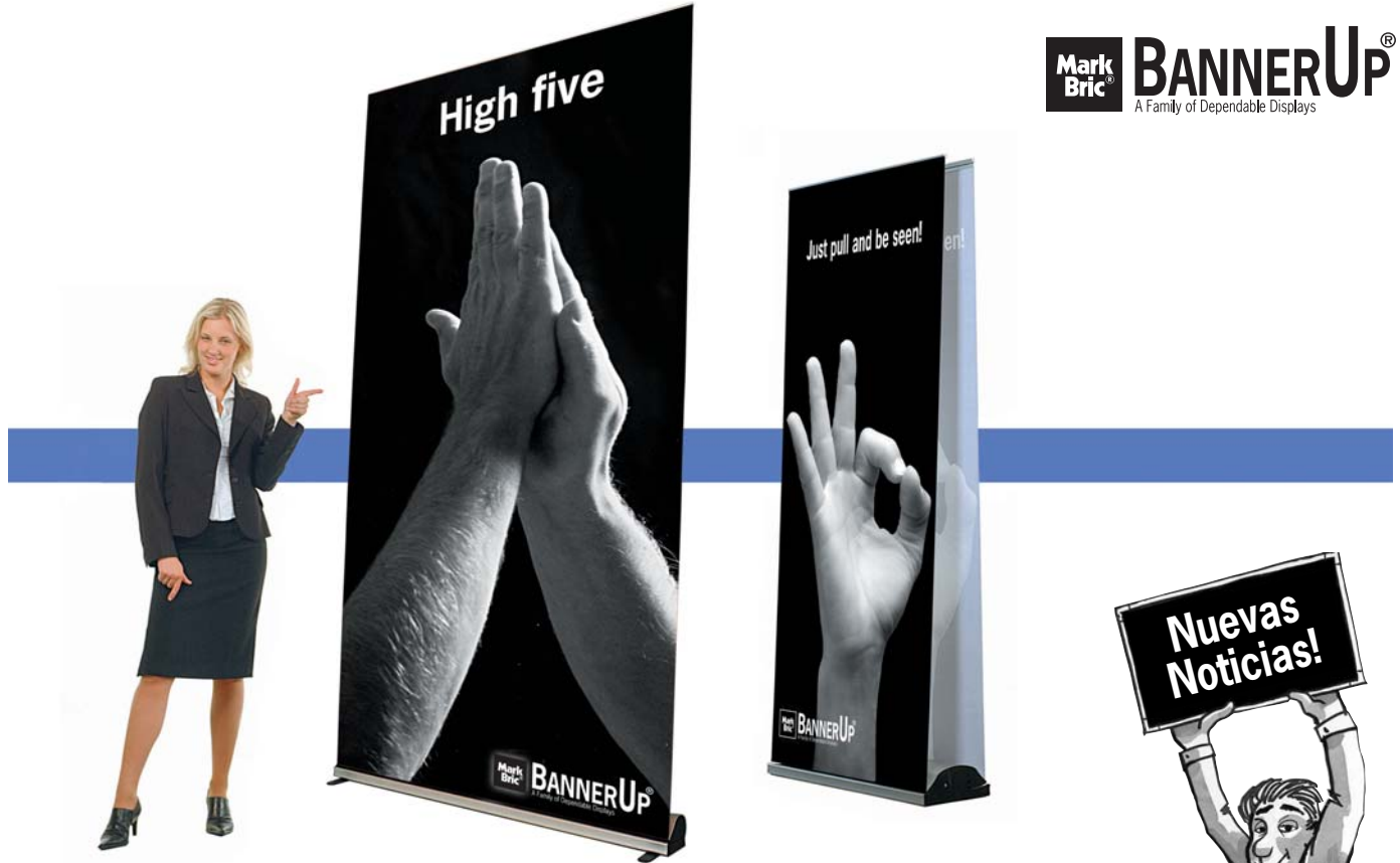
Nuevos BannerUp : Impresionante “Big Plus” y Doble cara “Double Plus”